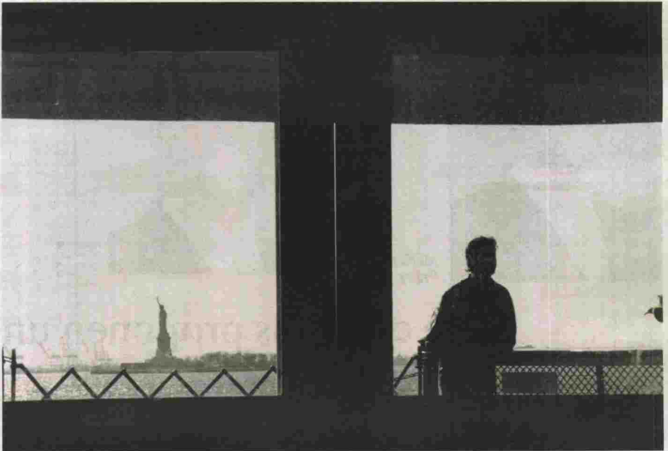
La Estatua de la Libertad desde el transbordador de Staten Island, en la bahía de Nueva York