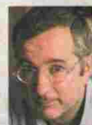
Alfonso Armada Reportero y escritor, autor de «El sueño americano. Cuaderno de viaje a la elección de Obama»

de su holgada existencia. Acaso fuera la ciudad del yo y yo, donde el deseo adquiere proporciones de mitología y el egoísmo es una fuente de codicia y de placer, el rabo de Cristina estuviera intentando alumbrar una metáfora. Pero lo que consigno aquí no son mas que hipótesis morales, ninguna ciencia. Porque el asunto de los rabos de los gatos es universal.